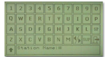
Display convertido en teclado