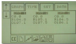
Presentación numérica de resultados